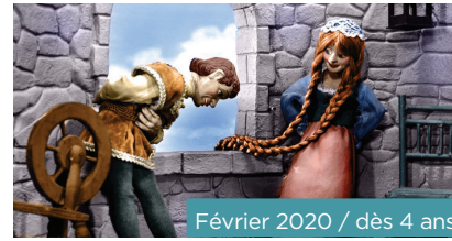
Février 2020 / dès 4 ans

A la suite d'une contamination, Scott voit avec effarement son corps rétrécir, à tel point que ses pires ennemis deviennent le chat ou l'araignée... Joyau de la science-fiction des années 50, ce film culte multiplie les trucages pour transformer une banalité domestique en un univers fantastique.