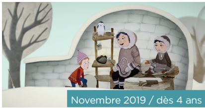
Novembre 2019 / dès 4 ans