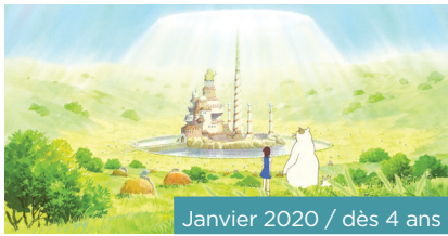
Janvier 2020 / dès 4 ans

Le professeur Roch et son assistant font une découverte révolutionnaire mais le Comte Artigas, qui rêve de devenir le maître du monde, les enlève pour s'emparer de leur invention... Inspiré d'un roman de Jules Verne, mêlant effets spéciaux et décors en gravures, ce film d'aventures est une merveille.