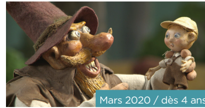
Mars 2020 / dès 4 ans

Ce programme conte les aventures du petit chaperon rouge, de Hansel et Gretel, de Raiponce et ses longs cheveux, du roi Midas, mais aussi du lièvre et de la tortue. Cinq contes de fée mythiques ont été animés par le roi de des effets spéciaux Ray Harryhausen, avec une inventivité et une poésie éblouissantes.