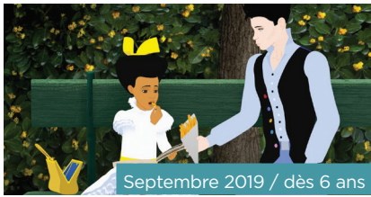
Septembre 2019 / dès 6 ans