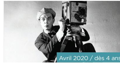
Avril 2020 / dès 4 ans

Aïlo, un petit renne sauvage, frêle et vulnérable, affronte les épreuves qui jalonnent sa première année de vie, au cœur de paysages grandioses de Laponie. A mi chemin entre un conte initiatique et un documentaire animalier aux superbes images, ce film est surtout un hommage vibrant à la vie sauvage.