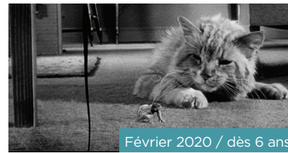
Février 2020 / dès 6 ans

Haru, une jeune collégienne, sauve un chat d'un accident de la circulation. Mais ce félin n'est autre que le fils du puissant roi des chats... Issu des studios Ghibli, comme Mon Voisin Totoro , cette fable poétique conte l'apprentissage du monde par une adolescence rêveuse, en recherche de bonheur.