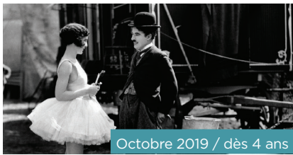
Octobre 2019 / dès 4 ans

Dans le Paris de la Belle Epoque, la petite kanake Dilili et un jeune livreur en triporteur enquêtent sur des enlèvements mystérieux de fillettes. Dans ce jeu de piste captivant du réalisateur de Kirikou , les deux amis, envers et contre tout, feront triompher la lumière, la liberté et la joie de vivre ensemble.