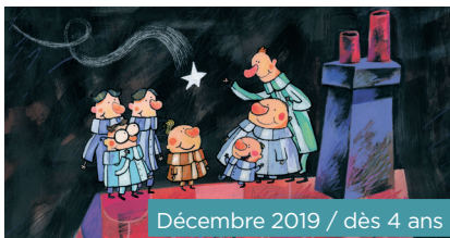
Décembre 2019 / dès 4 ans

Un petit village accueille la fête foraine annuelle, avec son cinéma ambulant. François, un facteur candide, découvre alors un reportage sur la poste américaine et se lance dans une distribution de lettres au rythme effréné, avec son drôle de vélo qui roule tout seul! Un chef-d'œuvre burlesque!