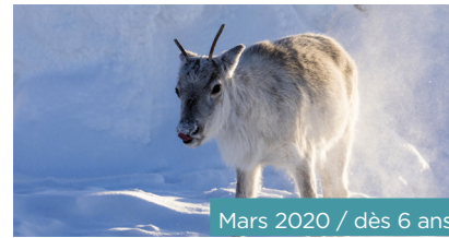
Mars 2020 / dès 6 ans

Au royaume de Tom Pouce, la compétition est rude... Qui remportera la main de la princesse qui ne rit jamais? Qui aura la plus belle des voitures? Qui réussira à être le plus malin, malgré sa petite taille? Ces trois films combinent pâte à modeler, papier découpé et marionnettes pour un effet renversant!