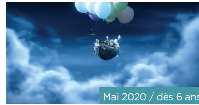
Mai 2020 / dès 6 ans

Buster, un romantique photographe de rue, devient caméraman pour conquérir le cœur d'une jolie secrétaire d'un studio d'actualités. Mais ses tentatives rocambolesques vont lui causer bien des surprises... Ce grand film burlesque prouvera au public de tout âge le pouvoir du cinéma!